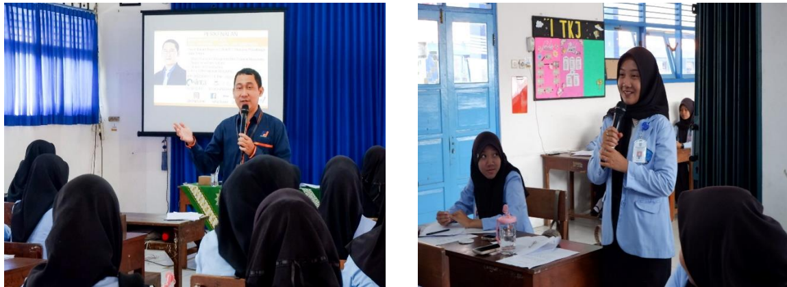
Gambar 2. Narasumber menyampaikan materi dan peserta antusias untuk bertanya

Program "Sosialisasi dan Pelatihan Soft skills bagi Siswa SMK Muhammadiyah 01 Purbalingg Menuju Dunia Kerja" telah dilaksanakan dengan melibatkan 66 siswa 66 dari Program keahlian Manajemen Perkantoran dan Layanan Bisnis (MPLB) kelas IX konsentrasi keahlian Manajemen Perkantoran (MP). Selama program berlangsung, siswa menunjukkan antusiasme yang tinggi dalam mengikuti berbagai kegiatan yang diselenggarakan. Dari sesi diskusi kelompok hingga role-playing dan simulasi, siswa berpartisipasi aktif dan menunjukkan minat yang besar untuk mengembangkan soft skills mereka. Narasumber yang diundang juga memberikan wawasan praktis yang sangat berguna bagi para siswa.