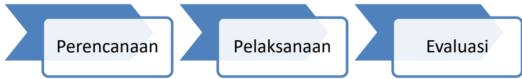
Gambar 1. Proses Kegiatan Pengabdian Kepada Masyarakat